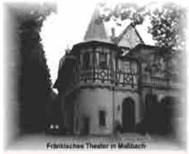
Fränkisches Theater in Maßbach